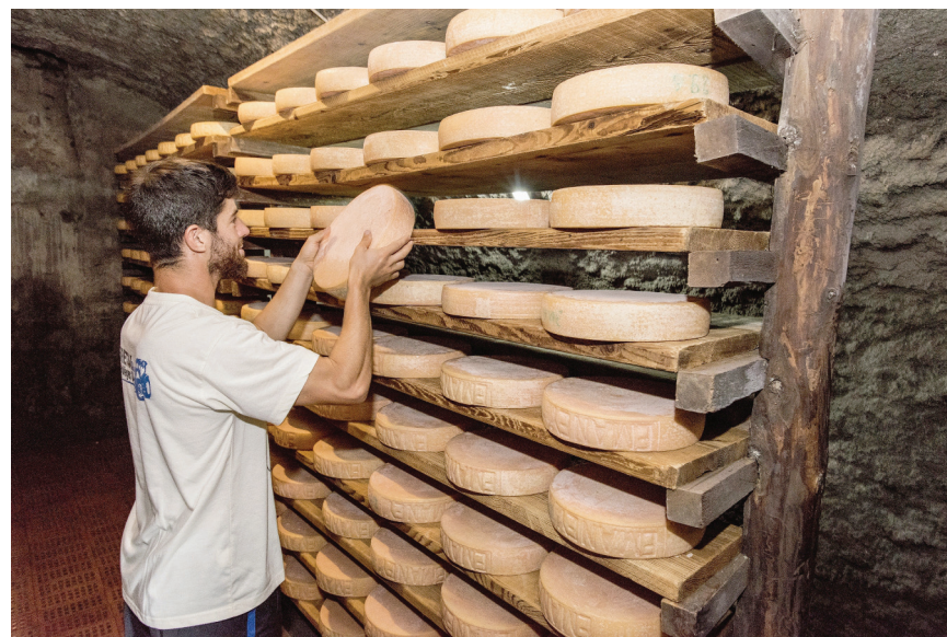
L'objectif du projet Interreg Typicalp est d'améliorer les revenus des fromagers dans les alpages valaisans et valdôtains.

Le projet Interreg Italie-Suisse Typicalp est réalisé en collaboration avec de nombreux partenaires. Côté suisse, on citera la HES-SO Valais-Wallis (Instituts technologie du vivant, informatique de gestion, entrepreneuriat & management), le Service cantonal de l'agriculture et des entreprises privées. Côté